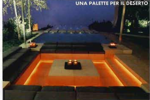
UNA PALETTE PER IL DESERTO

A Reggio Emilia, il progetto firmato da Christian Gasparini. Housescape Barbieri Cattini è una casa composta da volumi trapezoidali affacciati sull'esterno. Le vetrate diventano cornici dell'abitare, spazi scenografici svelati dalla luce artificiale. La luce naturale invece, penetrando all'interno dell'edificio a due piani, sottolinea il gioco di pieni e di vuoti che caratterizza l'architettura. www.natoffice.it