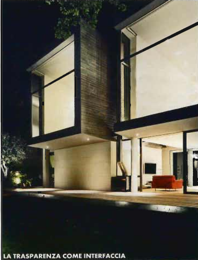
LA TRASPARENZA COME INTERFACCIA

Un'interpretazione di farmhouse tutta orientale, quella firmata da Maurice Asso per questa residenza nel deserto, a 30 km da Damasco, in Siria. Il progettista libanese ha utilizzato la luce Led colorata per sottolineare le parti funzionali del giardino, come per esempio piscina e soggiorno in esterno. Un intervento di landscape design pensato per legare in un unico percorso in e outdoor. www.hillights.net