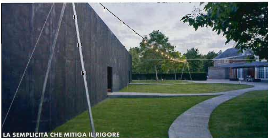
LA SEMPLICITÀ CHE MITIGA IL RIGORE

DISEGNATA Soluzioni sartoriali pensate ad hoc per imprimere più forza espressiva agli spazi, interni ed esterni