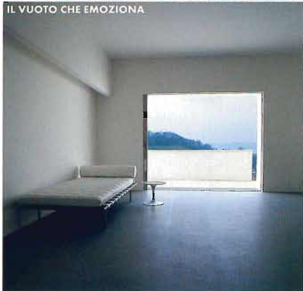
IL VUOTO CHE EMOZIONA

Senza mediazioni o compromessi nel progetto di Casa C a Vicenza di Vittorio Longheu, la luce naturale è protagonista e disegna una dimensione pura che vive della trasparenza: l'esterno nutre l'interno. "Lo spazio è uno scavo" diceva l'architetto americano Louis Kahn. "Un vuoto che vivè solo se attraversato dalla luce". www.vittoriolongheu.it . A destra, segue da pag. 113 il loft di K. Menten a Hasselt.